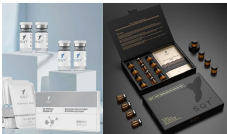
| Poslije tretmana

Nakon tretmana spužvinim spikulama kratko je vrijeme oporavka (šminka se sljedeći dan može normalno nanijeti).