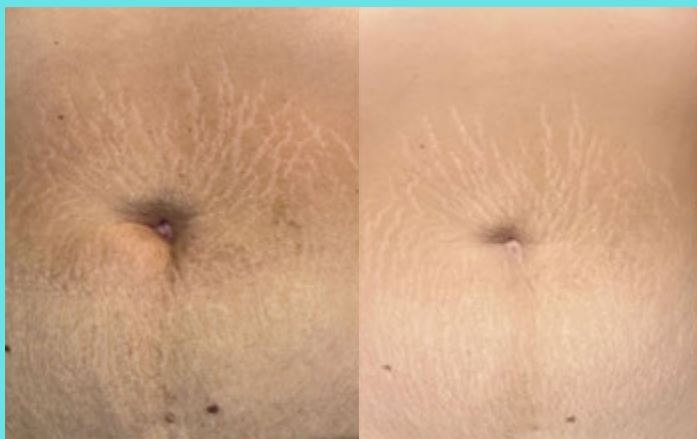
| Poslije tretmana